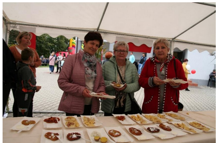
Koło Gospodyń Wiejskich w Rososzycy „Pyrczok - wiejskie święto ziemniaka”