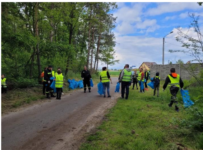
Ochotnicza Straż Pożarna Psary „Śmieci zbieramy – wieś Psary i gminę upiększamy”