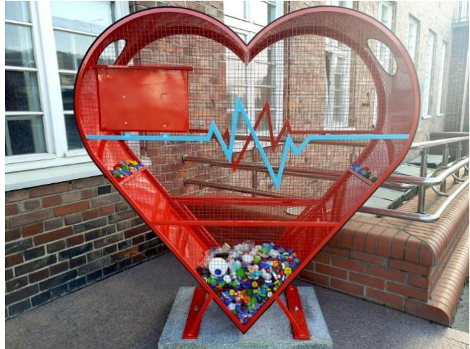
Stowarzyszenie Ekologiczno-Kulturalne „EKOklub”- „Ziemi na Ratunek”