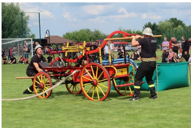
Ochotnicza Straż Pożarna Westrza „Zawody sikawek konnych”