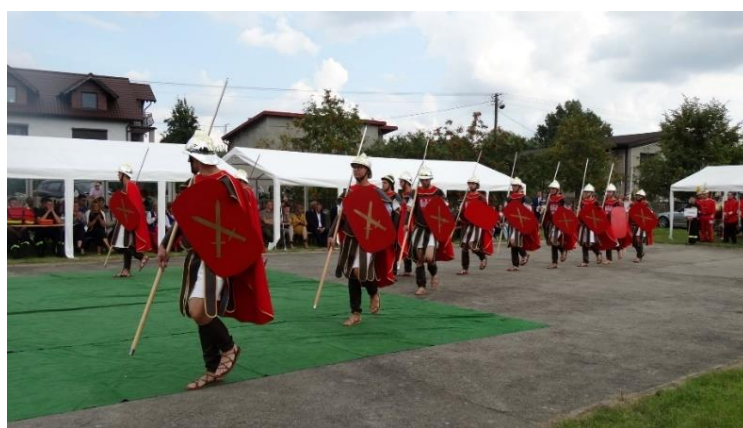
Stowarzyszenie Społecznej Aktywności „V Wielkopolska Parada Straży Grobu Pańskiego – Wielowieś 2021”