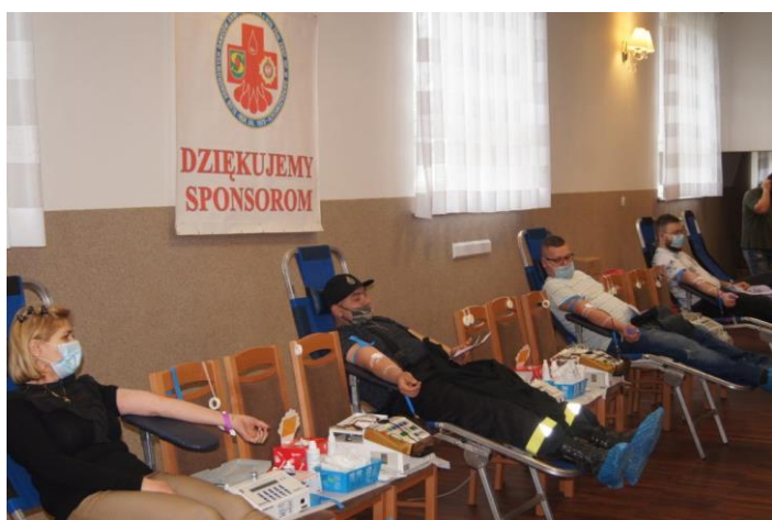
OSP Parczew - „Akcja poboru krwi”

W ramach otwartego konkursu ofert dla organizacji pozarządowych w 2021 roku gmina Sieroszewice współfinansowała zadania w sferach: kultury, sztuki, ochrony dóbr kultury i dziedzictwa narodowego, wspierania i upowszechniania kultury fizycznej, działalności na rzecz osób niepełnosprawnych, działalności na rzecz osób w wieku emerytalnym, turystyki i krajoznawstwa, ekologii i ochrony zwierząt oraz ochrony dziedzictwa przyrodniczego. Dzięki wsparciu z budżetu gminy zrealizowano m.in.: