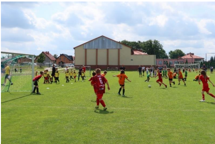
Szkolenie dzieci i młodzieży prowadzone przez GKS Iskra Proсна Sieroszewice