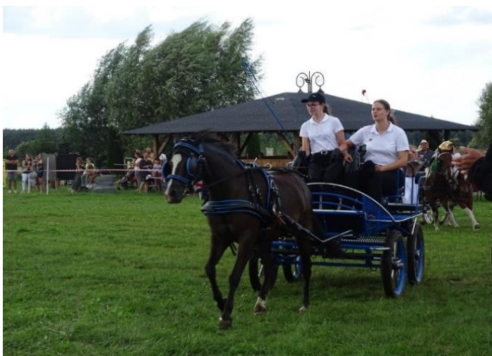
Koło Gospodyń Wiejskich w Strzyżewie „Powrót do tradycji”